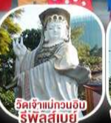
วัดเจ้าแม่กวนอิม รีพัลส์เบย์