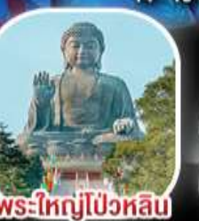
พระใหญ่ไผ่หวิน