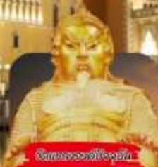
วัดพระธรรมมิทธาราม