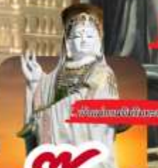
วัดพระธรรมมิทธาราม