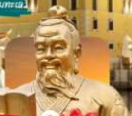
วัดฮวงตง