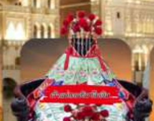
วัดพระธรรมมิทธาราม