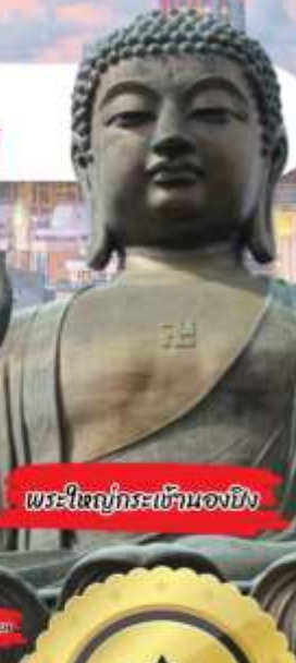
พระใหญ่ที่สะพานฮ่องกง