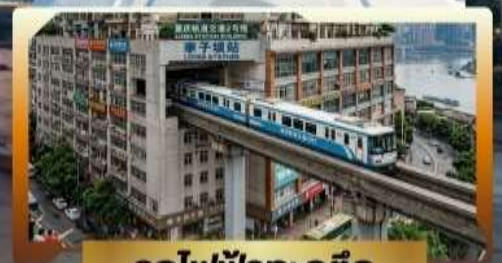
รถไฟฟ้ากะลุ่ตัก