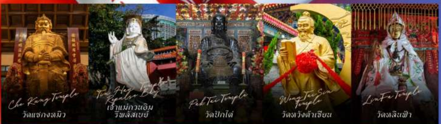
Che Kung Temple วัดเซกทมิว

รายการทัวร์ข้างต้นอาจมีการปรับเปลี่ยนเพื่อความเหมาะสม