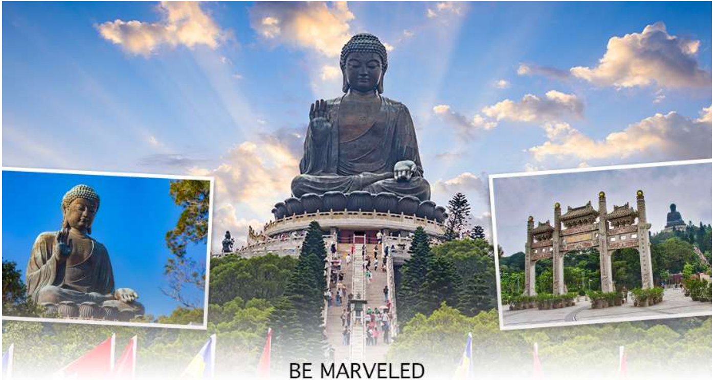
BE MARVELED พระใหญ่เทียนถาน

☉ อิศระอาหารเย็น เพื่อความสะดวกในการขอปิ้ง