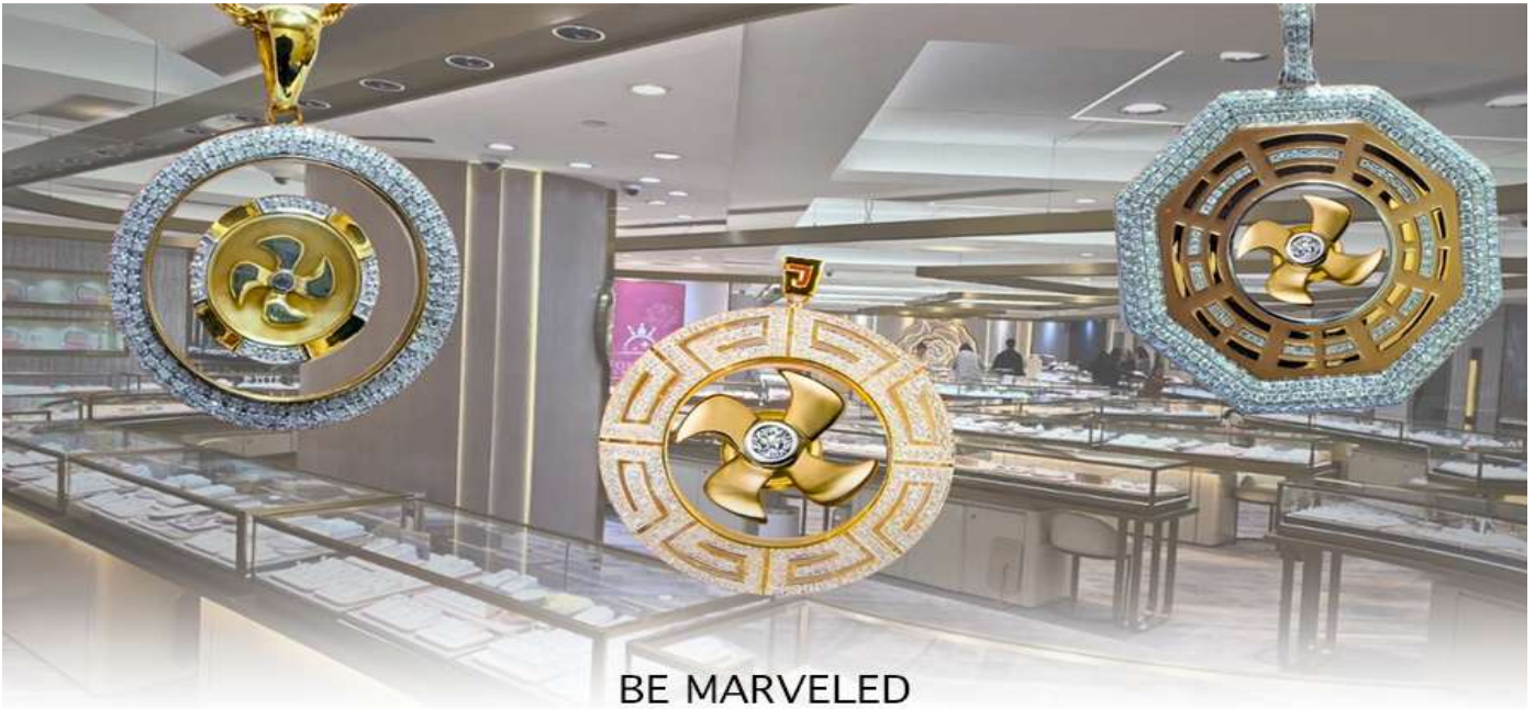
BE MARVELED គុណវិស័យ កំរងអិលធានា