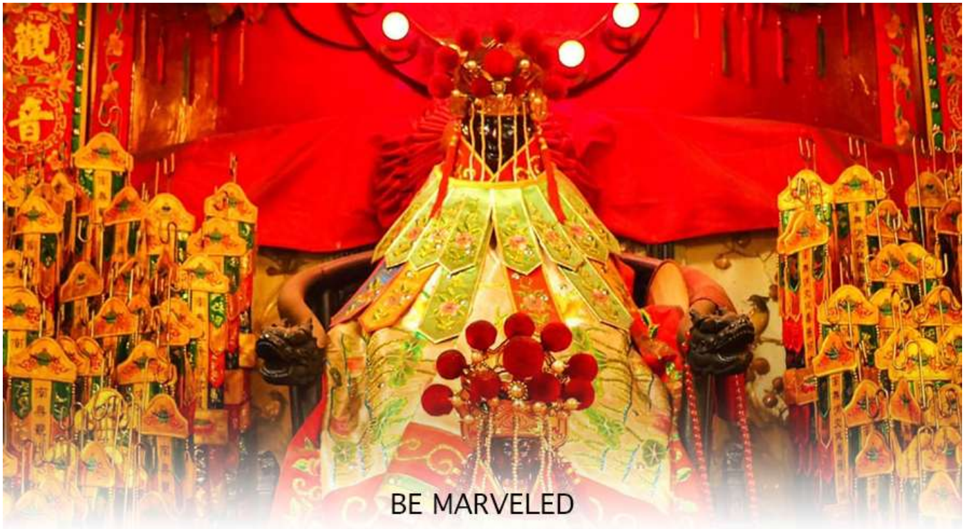
BE MARVELED วัดเจ้าแม่กวนอิมฮวงอ่า (ยิมเวิน)

ฮ่องกง-มาเก๊า จะมี "วันเปิดทรัพย์" หรือ "พิธียืมเงิน เจ้าแม่กวนอิมฮ่องกง" เป็นวันที่จะมาขอพรและยืมเงินเจ้าแม่กวนอิมซึ่งนับจากหลังวันตรุษจีน ไป 26 วัน จะเป็นวันเปิดทรัพย์ที่จัดขึ้นในทุกๆปี พิธีนี้จะมีเพียงครั้งปีละครั้งเท่านั้น เป็นวันสำคัญอีกวันที่คนหลังไหลมาไหว้ขอพรอย่างไม่ขาดสาย