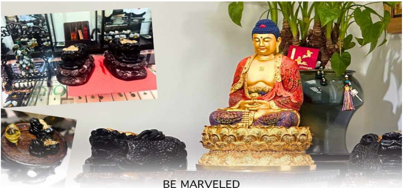
BE MARVELED គុណវិស័យ