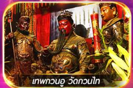
เทพทวนอู วัดกวนไท

พามุไหว้พระขอพร 8 วัดดัง เล่นเครื่องเล่นดิสนีย์แลนด์เต็มวัน ชมพลุสุดอลังการ