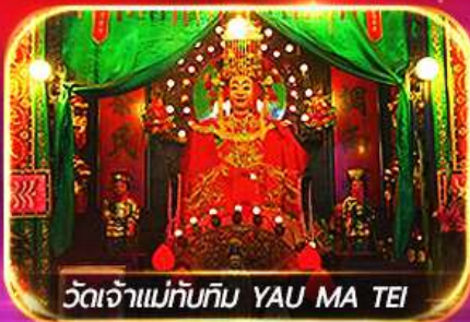
วัดเจ้าแม่ทับทิม YAU MA TEI