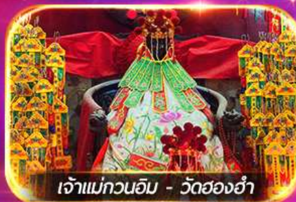
เจ้าแม่ทวนอิม - วัดฮ่องกง