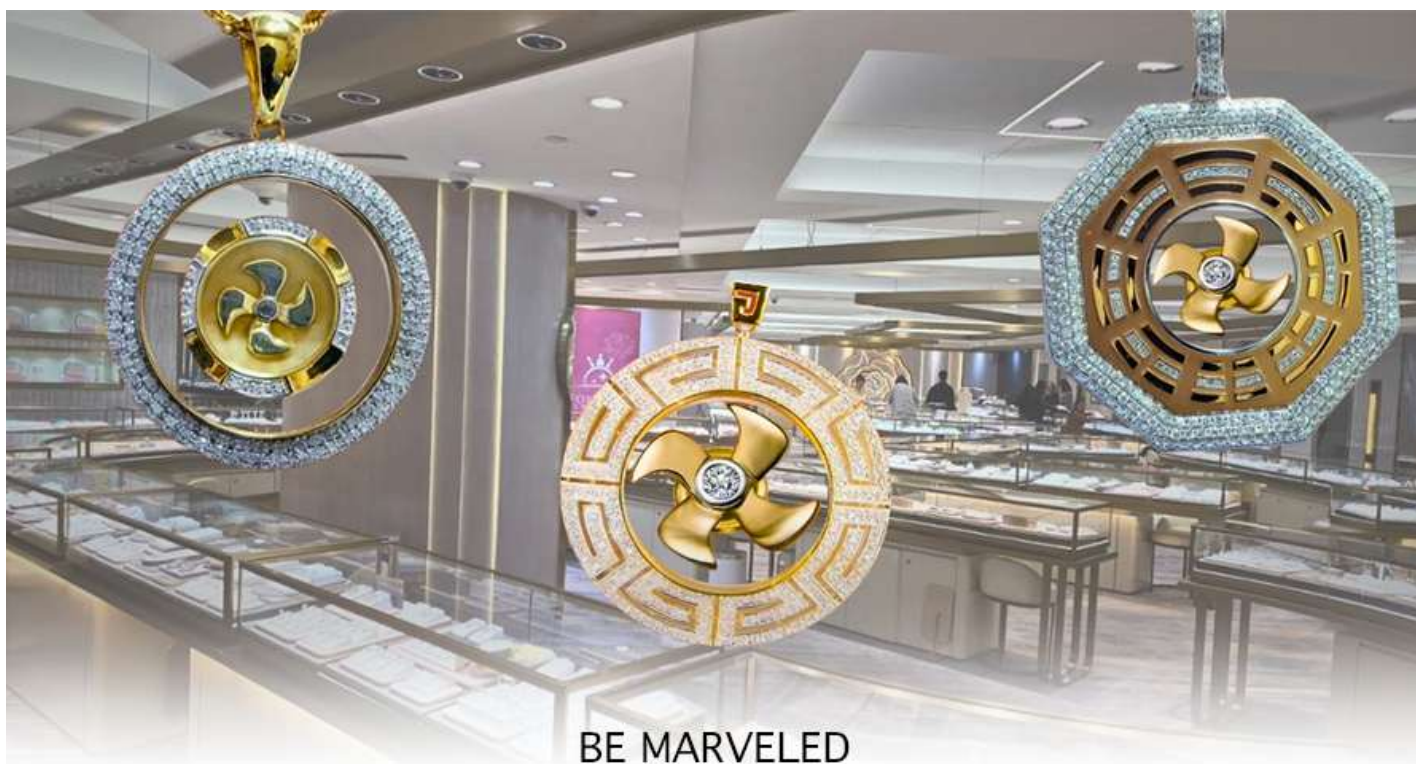
BE MARVELED ศูนย์ฮวงจุ้ย กังหันเศรษฐี

นำท่านชม ศูนย์ฮวงจุ้ย กังหันเศรษฐี ที่ขึ้นชื่อของฮ่องกง ท่านจะได้พบกับงานดีไซน์ที่ได้รับรางวัลยอดเยี่ยม และใช้ในการเสริมดวงเรื่องฮวงจุ้ย โดยการย่อใบพัดของกังหันที่เป็นสัญลักษณ์ของวัตต์แดงหงมิว มาทำเป็นเครื่องประดับ ไม่ว่าจะเป็นจี้, แหวน, กำไล หรือต่างหูเพื่อเป็นเครื่องประดับติดตัว และเสริมดวงชะตา ซึ่งสินค้าทุกชิ้นนี้ มีเอกสาร รับประกันคุณภาพเปลี่ยนหรือ ซ่อม ได้ตลอดอายุการใช้งาน หากเกิดการชำรุดจากสินค้าไม่ใช่อุบัติเหตุ