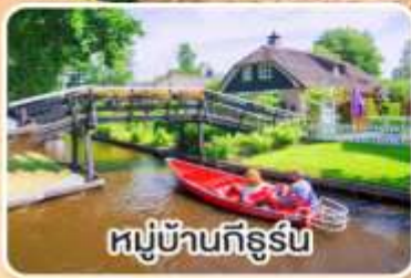
หมู่บ้านทีร์ูร์น