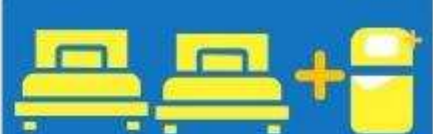
เตียง 3 ท่าน ที่นอนเสริม TRIPLE