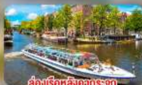
สองเรือหลังคากระจก