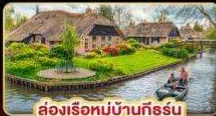
ล่องเรือหมู่บ้านกังหัน