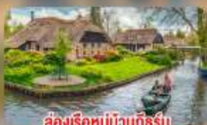
สองเรือหมู่บ้านทึร์น