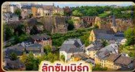
ลักซิมเบิร์ก

ที่สุดของธรรมชาติ แห่ง “ยุโรป” สวนดอกไม้ KEUKENHOF 1ปีมีครั้งเดียว