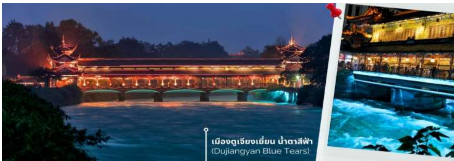
เมืองดูเจียงเยียน น้ำตาสีฟ้า (Dujiangyan Blue Tears)

ราวกับโลกแห่งจินตนาการ ความพิเศษอยู่ที่การจัดไฟอย่างประณีต ซึ่งช่วยเน้นให้สะพานมีชีวิตชีวาท่ามกลางบรรยากาศยามค่ำคืนที่รายรอบไปด้วยภูเขาและต้นไม้เพิ่มความรู้สึกสงบและสดชื่น เมื่อเดินข้ามสะพานนี้แล้วได้สัมผัสกับบรรยากาศรอบๆ มีแสงไฟที่ส่องประกายลงสู่ผืนน้ำจึงเป็นประสบการณ์ที่ทำให้รู้สึกผ่อนคลายและเต็มไปด้วยความประทับใจที่ยากจะลืม