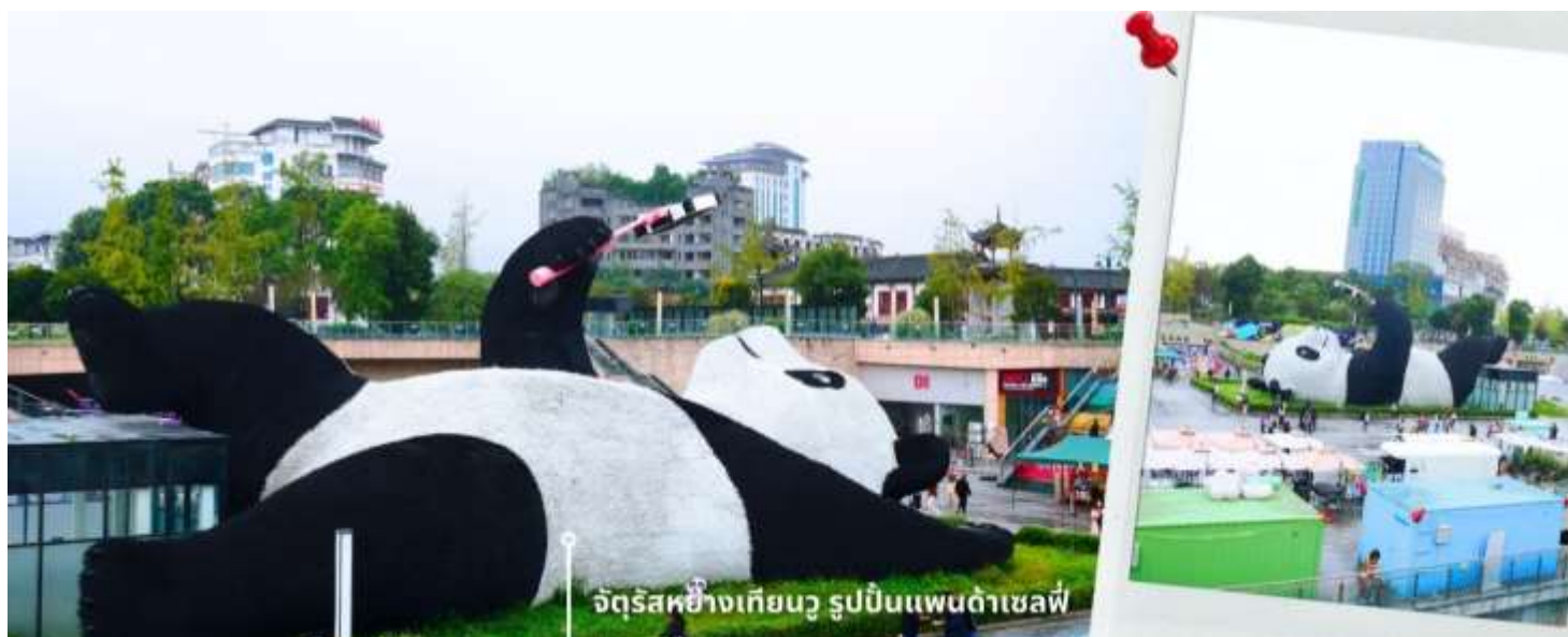
จัตุรัสหยางเทียนหวู่ รูปปั้นแพนด้าเซลฟ์

นำท่านเดินทางไปยัง จัตุรัสหยางเทียนหวู่ เป็นจุดเช็คอินที่สำคัญสำหรับคนที่มาเที่ยวที่ เมืองดูเจียงเยียน บริเวณจุดท่าข้าม อำเภอดูเจียงเยียน นครเฉิงตู ไฮไลท์ของจัตุรัสหยางเทียนหวู่ คือ ประติมากรรม แพนด้ายักษ์ที่กำลังนอนหงายท้องยื่นมือถือไม้เซลฟี่สีชมพู ซึ่งออกแบบโดยนักออกแบบชื่อดัง Florentijn Hofman รูปปั้นแพนด้า ยักษ์มีความยาว 26 เมตร กว้าง 11 เมตร สูง 12 เมตร และหนัก 130 ตัน แบบท่าทางสบายๆของแพนด้าที่ความประทับใจและรอยยิ้มให้กับผู้ที่มาเยือนจัตุรัสหยางเทียนหวู่ สามารถดึงดูดนักท่องเที่ยวได้เป็นจำนวนมากเลยทีเดียว เป็นการแสดงออกด้วยภาษาทางศิลปะแบบหนึ่งที่สะท้อนชีวิตในท้องถิ่น มอบความรู้สึกสนิทสนมและมีความสุขกับผู้ชม อิสระเดินชม