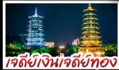
เจดีย์เงินเจดีย์ทอง

หมู่บ้านแม้วซีเจียง - จิวจ้ายโกวน้อย - เสียวชีโฮว เมืองโบราณเขยฮือ+ล่องเรือ - เจดีย์เงินเจดีย์ทองวิวก้า เขางวงช้าง - สะพานแดงหรูอี้ - รถไฟความเร็วสูง ไม่ลงร้านช้อปปิ้ง - เมมูพิเศษ บุฟเฟ่ต์ชาบูซีฟู้ด ปลาอบเนียร์ เผือกคริสตัล สุกี้หืด