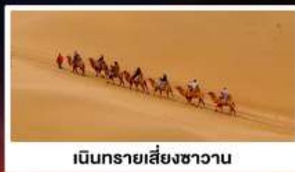
เนินทรายเสี่ยงชาวน