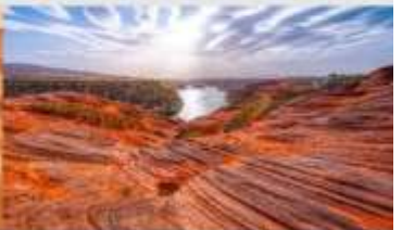
อุทยานหุบเขาคีลิน

*ทางบริษัทฯ ขอสงวนสิทธิ์ในการสืบโปรแกรมทัวร์ตามความเหมาะสมขึ้นอยู่กับสถานการณ์ทำงาน โดยค่าเดินทางผลประโยชน์ของลูกค้าเป็นสำคัญ