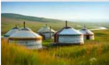
กุ้งหน้าออร์ดอส