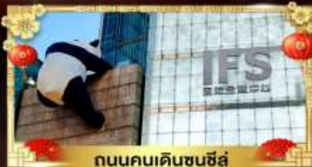
ถนนคนเดินชุนชี่อู่

เที่ยวอุทยานสวรรค์ระดับ 5A จิวจ้ายโกว "กู๋เขาสีดรุณี" อุทยานชื่อดังเหนียงชาน