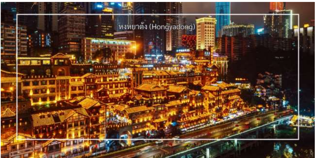
หงหยาดัง (Hongyadong)

นำท่านสู่ หงหยาดัง (Hongyadong) หรือที่เรียกว่า "Hongya Cave" เป็นสถานที่ท่องเที่ยวที่มีชื่อเสียงในเมืองฉงชิ่ง โดยตั้งอยู่ริมแม่น้ำแยงซี มีบรรยากาศที่เต็มไปด้วยวัฒนธรรมและประวัติศาสตร์ ตลาดหงหยาดังเป็นพื้นที่ที่มีอาคารแบบดั้งเดิมที่สร้างขึ้นในสไตล์สถาปัตยกรรมแบบซิโน-ทิเบต โดยมีร้านค้า ร้านอาหาร และบาร์จำนวนมาก ที่นี่คุณสามารถลิ้มลองอาหารท้องถิ่นที่อร่อย เช่น และขนมพื้นเมืองอื่นๆ นอกจากนี้ ตลาดหงหยาดังยังมีวิวทิวทัศน์ที่สวยงาม โดยเฉพาะในช่วงเย็นเมื่อไฟประดับส่องสว่าง ที่ทำให้บรรยากาศมีความโรแมนติกและน่าตื่นตึ่ง คุณสามารถเดินเล่นตามทางเดินที่มีการจัดแสดงงานศิลปะและสินค้าท้องถิ่น