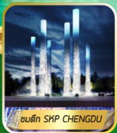
ชนตึก SKP CHENGDU