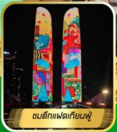
ชนตึกเฟดเทียนฟู