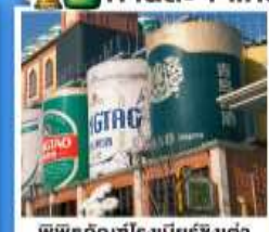
พิพิธภัณฑ์เบียร์ชิงต้า