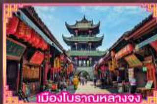
เมืองโบราณหลวงจง