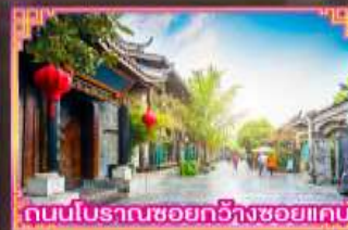
ถนนโบราณซอยกว้างซอยแคบ