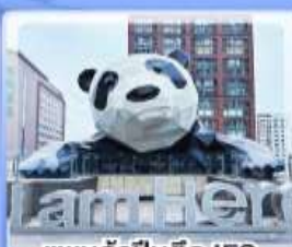
แพนด้าปิ่นตึก IFS