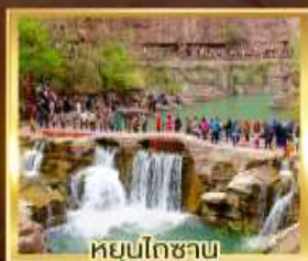
หยุ่นโกซาน