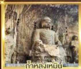
ถ้ำหลงเหมิน