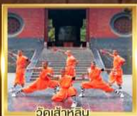
วัดเล่าหลิน