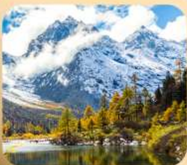
“ปี่ผิงโกว”

ชมธรรมชาติ 2 อุทยานขึ้นชื่อ อุทยานภูเขาสี่ดรุณี + อุทยานปี่ผิงโกว สะพานหนานเฉียว • ถนนคนเดินไก่อู๋หลี่ + ซุนซีลู่ + Pop Mart • ดงเจียวจื่อ