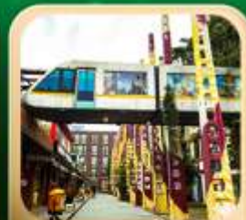
“ดงเจียวจื่อ”