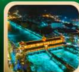
“สะพานหนานเฉียว น้ำตาสีฟ้า”