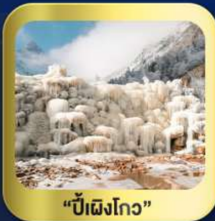
"ปี้ผิงโกว"

นั่งกระเช้าชมวิว ภูเขาหิมะ-ต้ากู่กลาเซียร์ • ชมความสวยงาม ณ อุทยานปี้ผิงโกว ห้องสมุดจงซูเก๋อ • ศูนย์หมีแพนด้า • ตงเจียวจี้อี้ • ซอยกวางชอยแคบ