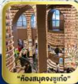
"ห้องสมุดจงซูเก๋อ"