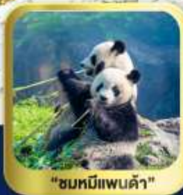
"ชมหมีแพนด้า"