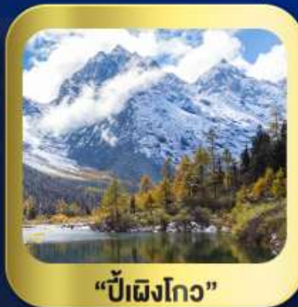
"ปี้ผิงโกว"