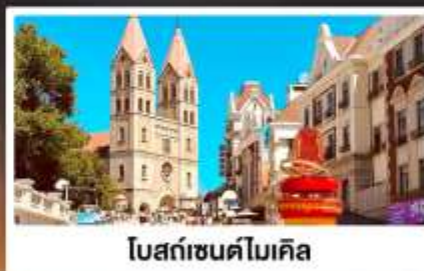
โบสถ์เซนต์ไมเคิล