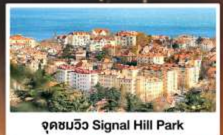
จุดชมวิว Signal Hill Park