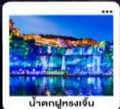
น้ำตกฟูหลงเจิน

"มหัศจรรย์...จางเจียเจีย" | ดินแดนแห่งขุนเขาและสายน้ำ "เขาเกียนเหมินซาน" | ประตูสวรรค์...ทำทนายศรึกษา 999 ชั้น | บั้งรถไฟความเร็วสูง สัมผัสความสวยงามตระการตา "อุทยานอวตาร" | ส่องล่องกลางขุนเขา...ดั่งภาพฝันในห้วงนภีเจียเจีย | ช็อปปัง POPMART "เมืองโบราณ" ฟูหลง หยดเวลา ณ เมืองบนม่านน้ำตก... | "เฟิ่งหวง" ส่องเรือชมชีวิตริมแม่น้ำถิวเจียง "นครฉางซา" ปิดท้ายความทันสมัย