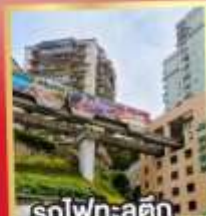
รถไฟเหาะลัดค