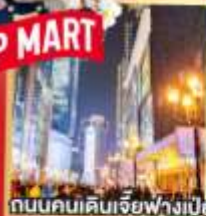
ถนนคนเดินเจียฟางเป่ย์