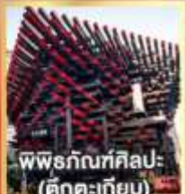
พิพิธภัณฑ์ศิลปะ (ตึกตะเกียบ)

01-03, 03-05, 17-19, 22-24 เม.ย. 69 15,900