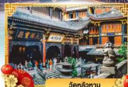
วัดหลิวทาน