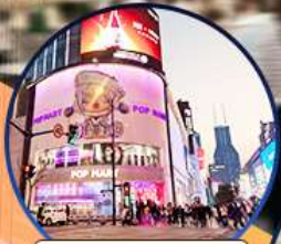
ถนนหนานจิง