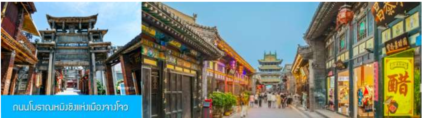
ถนนโบราณหมิงชิงแห่งเมืองจางโจว

หลังอาหารนำท่านเดินทางสู่เมือง จางโจว นำชม ถนนโบราณหมิงชิงแห่งเมืองจางโจว 漳州明清古街 ถนนสายนี้ถูกสร้างขึ้นในราชวงศ์หมิงอายุราว 300 ปี สองข้างถนนเต็มไปด้วยอาคารบ้านเรือนโบราณ ที่อดีตเคยเป็นสถานที่สำคัญของเมืองจางโจว อาทิ ศาลหลักเมือง จวนผู้ว่าเมือง ชุมประตูดินโบราณ ฯลฯ