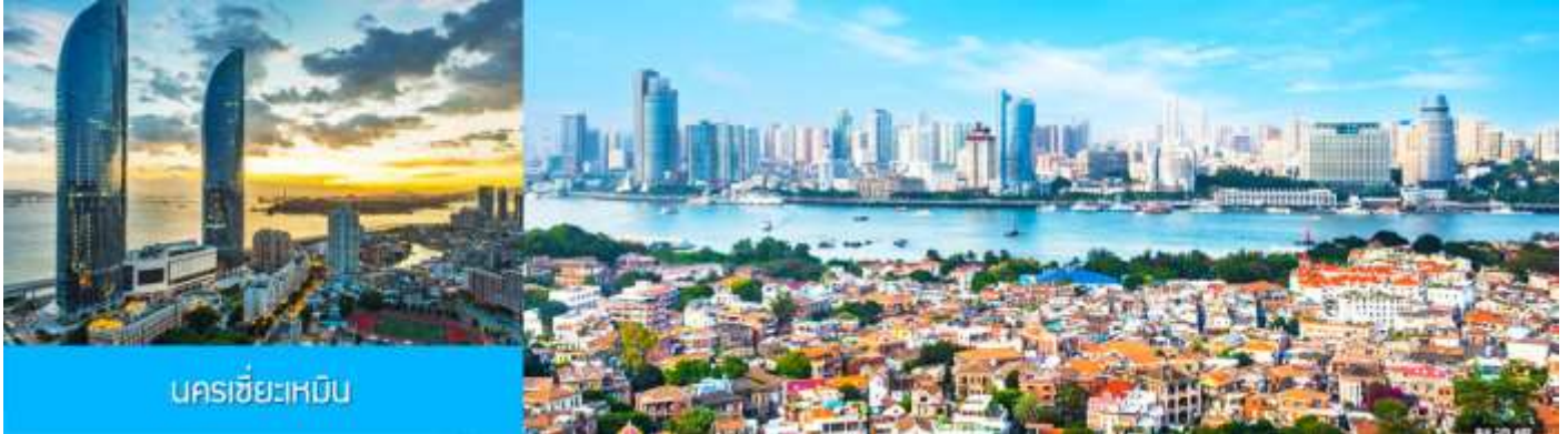
นครซีอะเหมิน

23.30 น. คณะเดินทางพร้อมกันที่ ท่าอากาศยานสุวรรณภูมิ อาคารผู้โดยสารขาออกชั้น 4 ประตูหมายเลข 10 เคาน์เตอร์ เช็คอิน สายการบิน XIAMEN AIRLINES (MF) เจ้าหน้าที่บริษัทฯ คอยให้การต้อนรับและอำนวยความสะดวกในการเช็คอิน