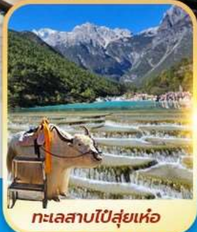
ทะเลสาบโป๋สุ่ยเหอ