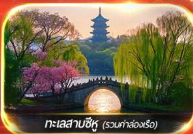
ทะเลสาบซีหู (รวมค่าล่องเรือ)