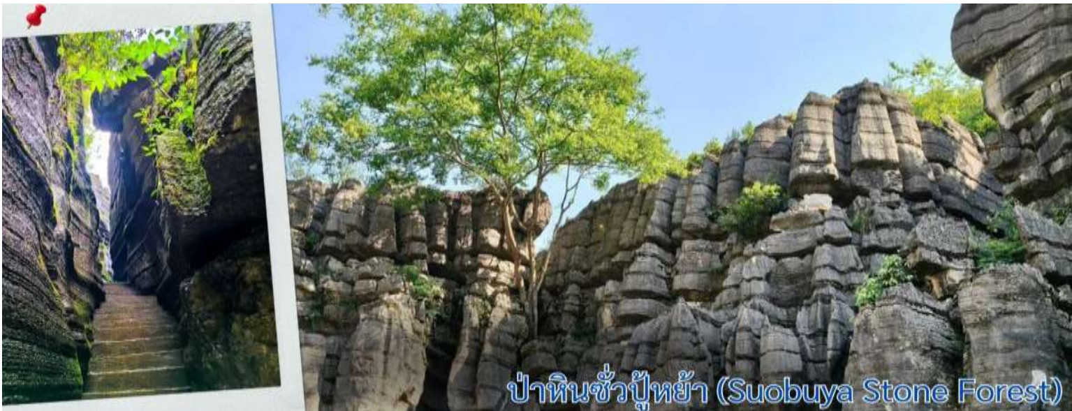
ป่าหินซั่วปู้หย้า (Suobuya Stone Forest)

จากนั้นนำทุกท่านเดินทางสู่ ป่าหินซั่วปู้หย้า (Suobuya Stone Forest) คือ เป็นสถานที่ท่องเที่ยวระดับชาติเกรด AAAA ของจีน ตั้งอยู่ห่างจากเมืองเอนชือ มณฑลหูเป่ย์ ไปทางเหนือ 54 กิโลเมตร ในภาคกลางของจีน ได้ รับการขนานนามว่าเป็นป่าหินที่ใหญ่เป็นอันดับสองของจีน (อันดับแรกคือป่าหินในเมืองคุนหมิง มณฑลยูนนาน ทางตะวันตกเฉียงใต้ของจีน) และเป็นสถานที่ที่นักท่องเที่ยวที่ชื่นชอบ สามหุบเขาของแม่น้ำแยงซีต้องไปเยือน ครอบคลุมพื้นที่ทั้งหมด 21 ตารางกิโลเมตร ระดับความสูงเฉลี่ยมากกว่า 900 เมตร หากมองจากมุมสูง พื้นที่ท่องเที่ยวแห่งนี้มีรูปร่างคล้ายน้ำเต้าขนาดใหญ่ ล้อมรอบด้วยฉากสีเขียวและยอดเขา ป่าหินซั่วปู้หย้าเป็นป่าหินที่ใหญ่เป็นอันดับสองของจีน โดยมีพิภพธรณเป็นอันดับหนึ่งของประเทศ และนี่คือสิ่งที่ทำให้โดดเด่นกว่าหินปูนอื่นๆ ในภาคตะวันตกเฉียงใต้ของจีน ป่าหินซั่วปู้หย้ามีพิภพธรณขึ้นปกคลุมอย่างหนาแน่นราวกับสวมหมวก จึงได้ชื่อว่า ป่าหินสวมหมวก