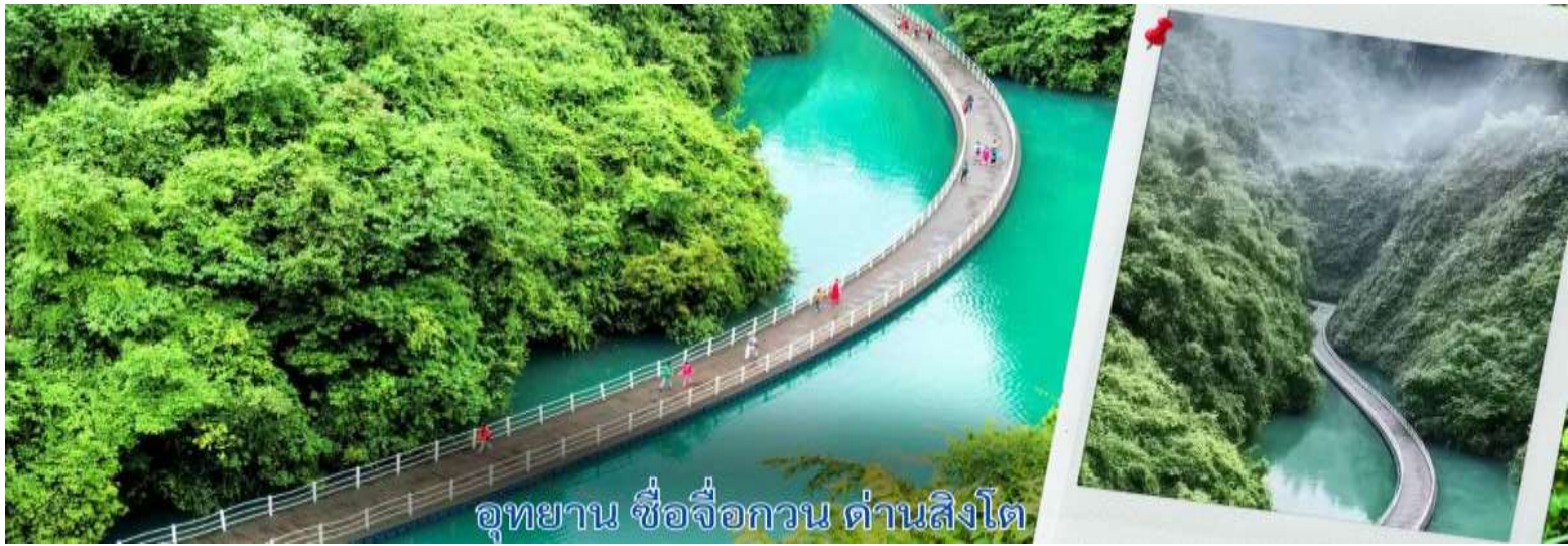
อุทยาน ซื่อจื่อกวน ด้านสิงโต

สะพานนี้ถือเป็นหนึ่งใน สะพานลอยน้ำที่ยาวและสวยที่สุดในจีน รถอุทยานสามารถวิ่งข้ามสะพานได้ ตอนเล่นผ่านคือทั้ง ตื่นเต้นและประทับใจมาก เพราะวิวรอบตัวคือภูเขาเขียวขจีและผืนน้ำที่สะท้อนท้องฟ้าอย่างสวยงาม