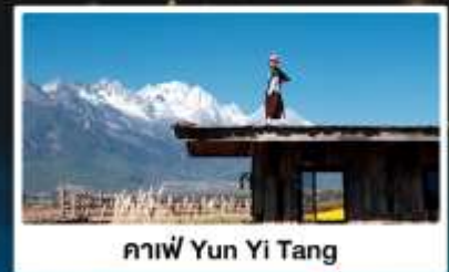
คาเฟ่ Yun Yi Tang