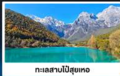
ทะเลสาบโป๋สยู่เหอ