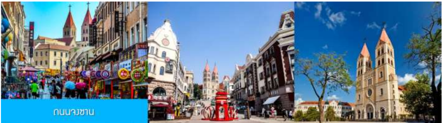
ถนนวาซาน