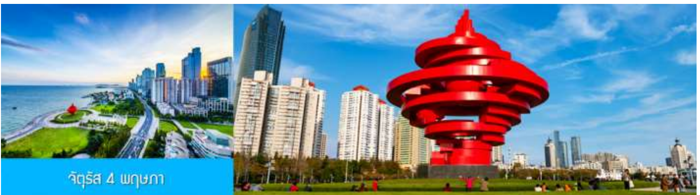
จัตุรัส 4 พฤษภาคม

จากนั้นนำท่านเที่ยวชม โรงเบียร์ชิงเต่า 青岛啤酒博物馆 พิพิธภัณฑ์เบียร์ที่ขึ้นชื่อของเมืองชิงเต่า ซึ่งเป็นเบียร์ยี่ห้อแรกที่ผลิตขึ้นในประเทศจีน ชมเบียร์ คอลเลกชันที่มียี่ห้อหลากหลายที่สุดของโลก และชมการจัดแสดงภาพและวิดิทัศน์เกี่ยวกับวิวัฒนาการของเบียร์ ขั้นตอนการผลิตและอื่น ๆ ที่เกี่ยวข้อง พร้อมชิมเบียร์ชิงเต่า ซึ่งเป็นเบียร์ที่ขายดีที่สุดยี่ห้อหนึ่งของจีน.. (ชิมเบียร์ชิงเต่าท่านละ 1 แก้ว รับกลับอีก 1 ขวดเล็ก ตอนเดินออก)