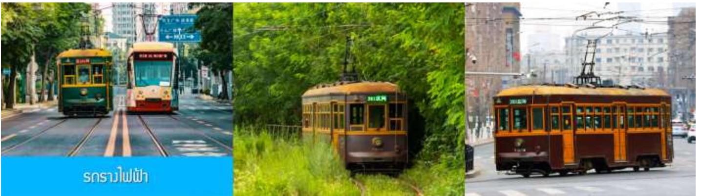
รถรางไฟฟ้า