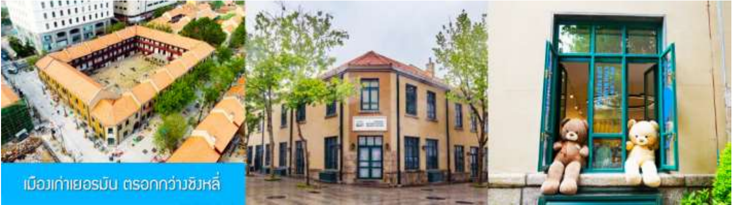
เมืองเก่าเยอรมัน ตรอกกว้างชิงหลี่

จากนั้นเดินทางต่อสู่ย่าน เมืองเก่าเยอรมัน ตรอกกว้างชิงหลี่ 广兴里 ตรอกซอกซอยที่เรียงรายไปด้วยอาคารสถาปัตยกรรมแบบผสมผสานแบบจีนและอาคารสไตล์ยุโรป