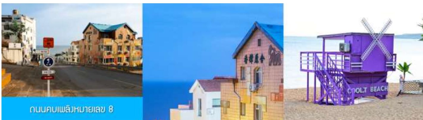
ถนนคบเพลิงหมายเลข 8

นำท่านชมสวนสาธารณะ威海公园 สวนสาธารณะริมทะเลที่ใหญ่ที่สุดของเมือง威海 ให้ท่านชมและถ่ายภาพคู่กับ กรอบรูปยักษ์วิวทะเล 威海公园大相框 แลนด์มาร์คที่เป็นอีกหนึ่งไฮไลท์ที่ฮิตของเมือง威海