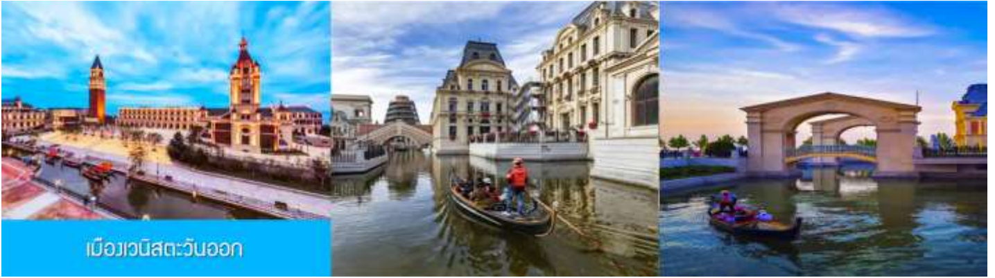
เมืองเวนิสตะวันออก