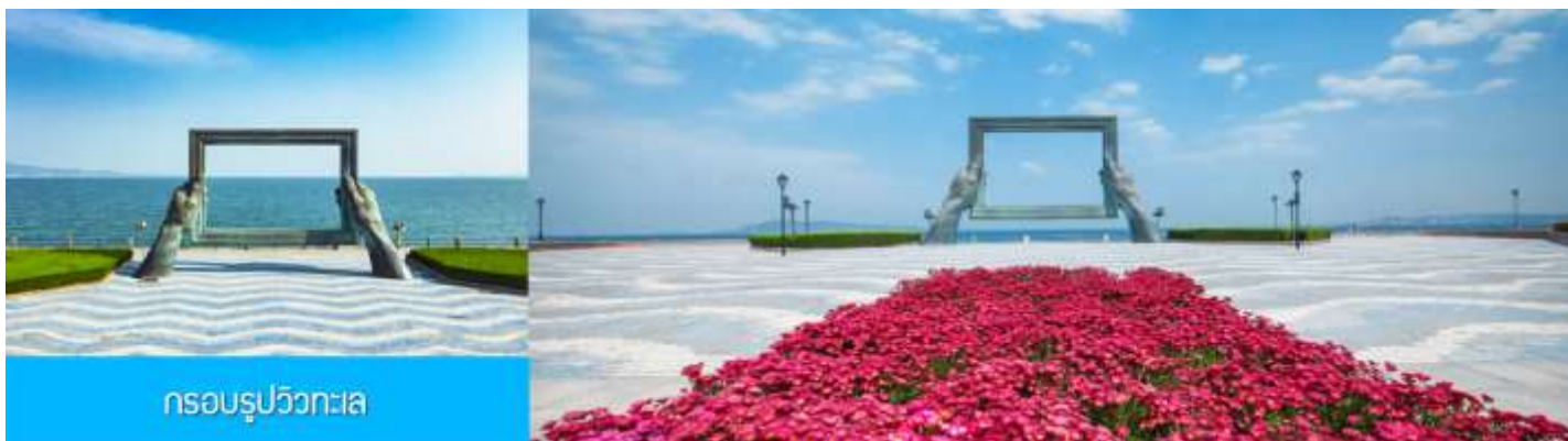
กรอบรูปวิวทะเล

นำท่านชมสวนสาธารณะ威海公园 สวนสาธารณะริมทะเลที่ใหญ่ที่สุดของเมือง威海 ให้ท่านชมและถ่ายภาพคู่กับ กรอบรูปยักษ์วิวทะเล 威海公园大相框 แลนด์มาร์คที่เป็นอีกหนึ่งไฮไลท์ที่ฮิตของเมือง威海