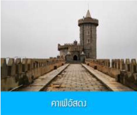
คาเฟ่อีสถ