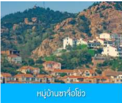
หมู่บ้านซาจื่อโข่ว

จากนั้นนำท่าน เดินทางสู่ คาเฟ่อีสถ 落日古堡 นำท่านชมปราสาทในเทพนิยาย ที่ตั้งตระหง่านอยู่ริมชายหาด นานาชาติเวทย์ให้ คาเฟ่ที่ออกแบบด้วยสถาปัตยกรรมสไตล์ยุโรป ตัดกับวิวทะเลสีคราม และที่นี่คือแม่เหล็กดึงดูดนักท่องเที่ยวมาเก็บบรรยากาศความสวยงามความโรแมนติก ( ตัวปราสาทเป็นร้านกาแฟ หากท่านต้องการเข้าไปด้านใน ต้องจ่ายค่าเครื่องดื่ม ตามเมนูของทางร้าน ซึ่งไม่รวมในอัตราค่าทัวร์ )