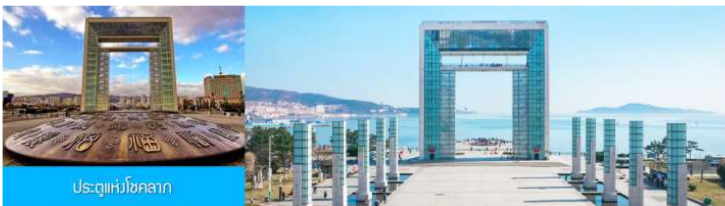
ประตูแห่งโชคกลาง