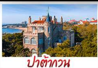
ป่าตึกวน

พระราชวังฤดูร้อน - วิวเมืองชิงเต่า รถไฟความเร็วสูง - ภูเขาเหลาซาน กำแพงเมืองจีนด่านจวิยงกวน - ป่าตึกวน พักโรงแรมระดับ 4 ดาว - ไม่ลงร้านซื้อ! มือพิเศษ เปิดปักกิ่ง , หม้อไฟซีฟู้ด