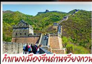
กำแพงเมืองจีนด่านจวิยงกวน