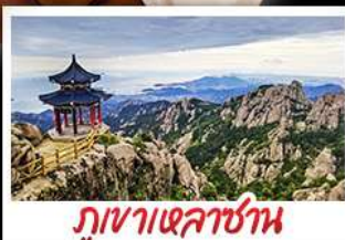
ภูเขาเหลาซาน