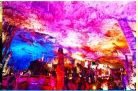
ถ้ำแก้วสวรรค์วิเวกเทียนถ้ำ