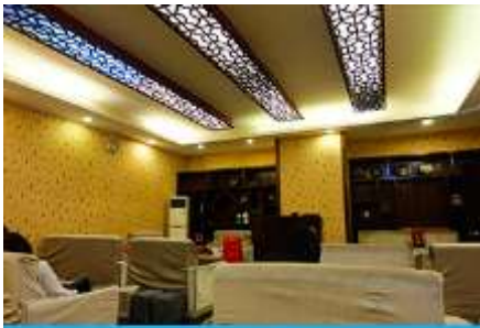
ศูนย์แพทย์แผนจีน

อัตราค่าบริการสำหรับโปรแกรมเสริมการแสดงชุด The love Story of Wooden man and Fairy Fox ท่านละ 400 หยวน (หรือประมาณ 2000.-บาทขึ้นอยู่กับอัตราแลกเปลี่ยน) ระยะเวลาที่ใช้ในการเที่ยวชมการแสดง ประมาณ 3 ชั่วโมง รวมเวลา เดินทางไป กลับค่าบริการรวม ค่าบัตรเข้าชม ค่ารถรับ ส่ง และค่าน้ำดื่มของไกด์ท้องถิ่น