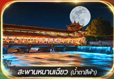
สะพานหนานเจียว (น้ำตาสีฟ้า)