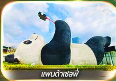
แพนด้าเซลฟ์