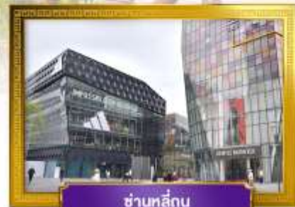
ชานหลู่กุน