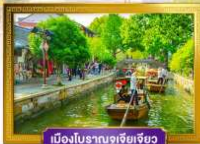
เมืองโบราณซูเจียเจียว