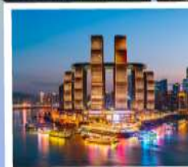
ตึกรูปเฟี๊