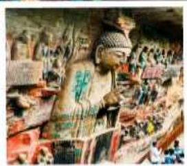
ผาหินแกะสลักต้าจู้