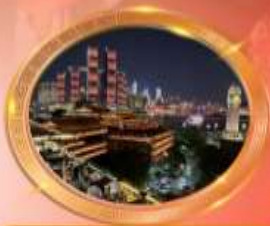
มือตำร้านอาหารริวหลีกส์ล้าน