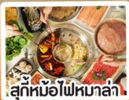
สุกัหม้อไฟหมาล่า