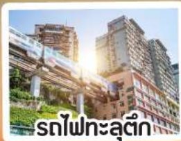
รถไฟฟ้ากะลุดัก