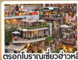
ตรอกโบราณเซียวฮ่าวหลี่