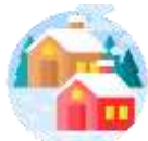
เมืองเซอร์แมท

เช้า บริการอาหารเช้า ณ ห้องอาหารของโรงแรม (11)