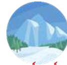
เทือกเขาคอร์เนอร์แกรต ชมวิวยอดเขาแมทเทอร์ฮอร์น

นำท่านเดินไปยังสถานีรถไฟ เพื่อขึ้นรถไฟขึ้นสู่ เทือกเขาคอร์เนอร์แกรต (Gornergrat) (ใช้เวลาในการเดินทางประมาณ 15 นาที) รถไฟคอร์เนอร์แกรตเป็นรถไฟขึ้นภูเขาที่ตั้งอยู่ในรัฐวาเล ที่เชื่อมกับหมู่บ้านเซอร์แมท สถานีรถไฟคอร์เนอร์แกรต ให้ท่านถ่ายรูปตามอัธยาศัย ชมวิวยอดเขาแมทเทอร์ฮอร์น (Matterhorn) มงกุฎแห่งสวิตเซอร์แลนด์ นำท่านนั่งรถไฟคอร์เนอร์แกรตลงมาสู่ เมืองเซอร์แมท อิสระให้ท่านเดินชมเมืองเซอร์แมท และพักผ่อนตามอัธยาศัย นำท่านเดินทางสู่ เมืองทาช (Tasch) ด้วย Shuttle Train จากสถานีรถไฟเซอร์แมท สู่สถานีรถไฟทาช (ใช้เวลาในการเดินทางประมาณ 30 นาที)