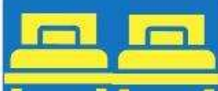
ห้องพักเตียงคู่ TWIN