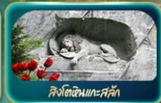
สิงโตหินแกะสลัก