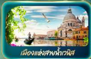
เมืองแห่งสายน้ำเวนิส

จุดบรรจบความอลังการของธรรมชาติ Dolomites และ ทะเลสาบมิซูร์น่า ชมน้ำสิเทอร์ควอยซ์ ทะเลสาบเบริส สูดโรแมนติกเมืองแห่งสายน้ำเวนิส ห้ามพลาด มหาวิหารดูโอโมแห่งมิลาน โรมัน ฮาร์น่า บ้านของจูเลียต เที่ยวลูเซิร์น ชมสิงโตหินแกะสลัก เดินเล่นสะพานไม้อาเปลา อินส์บรุค ย้อนอดีตกับเสาชอนด์แอนน์ หลังคาทองคำ ช้อปปิ้ง Outlet