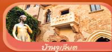
บ้านลูเลียง