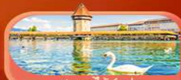
สะพานไม้ซังปก