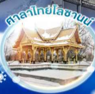
ศาลาไทยโลซานน์