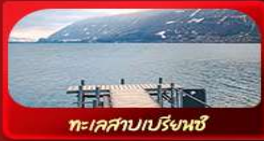
ทะเลสาบเบริงพซ์

สวิตเซอร์แลนด์แดนในฝัน ขึ้นยอดเขาจุงเฟรา พิชิต TOP OF EUROPE เดินเล่นเมืองเจนีวา เวอเวย์ ถ่ายรูปกับชาร์ลี แชปลิน และปราสาทซิลองริมทะเลสาบ ชมความน่ารักป้อมหมีสีน้ำตาล ตามรอยซีรีส์ดัง Crash Landing on You ทะเลสาบเบรียนซ์ สะพานไม้ชาเปล อนุสาวรีย์สิงโต หมู่บ้านเลาเทอร์บรุนเนิน น้ำตกเตาบ็อค น้ำตกโรนิน เดินเล่นเมืองเก่า ช้อปหรูที่ถนนบาห์นโฮฟสตราซอร์