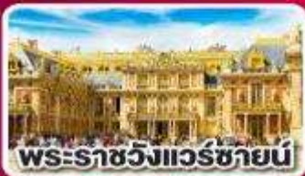
พระราชวังแอมสแตร์ดัม