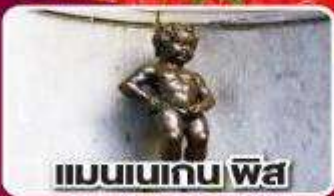
แมนเนเกน พิส