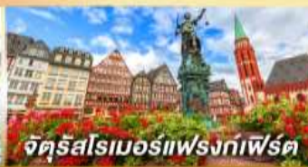
จัตุรัสโรเมอร์แฟรงก์เฟิร์ต