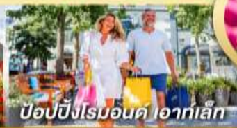
ป๊อปปิงโรมอนด์ ไอท์เล็ก