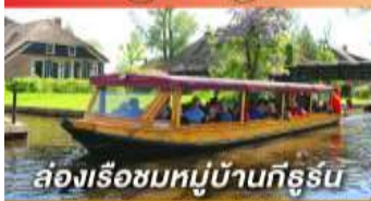
ล่องเรือชมหมู่บ้านกังหัน