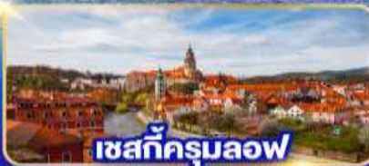
เชสท์ครุมลอฟ