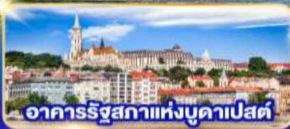
อาคารรัฐสภาแห่งบูดาเปสต์